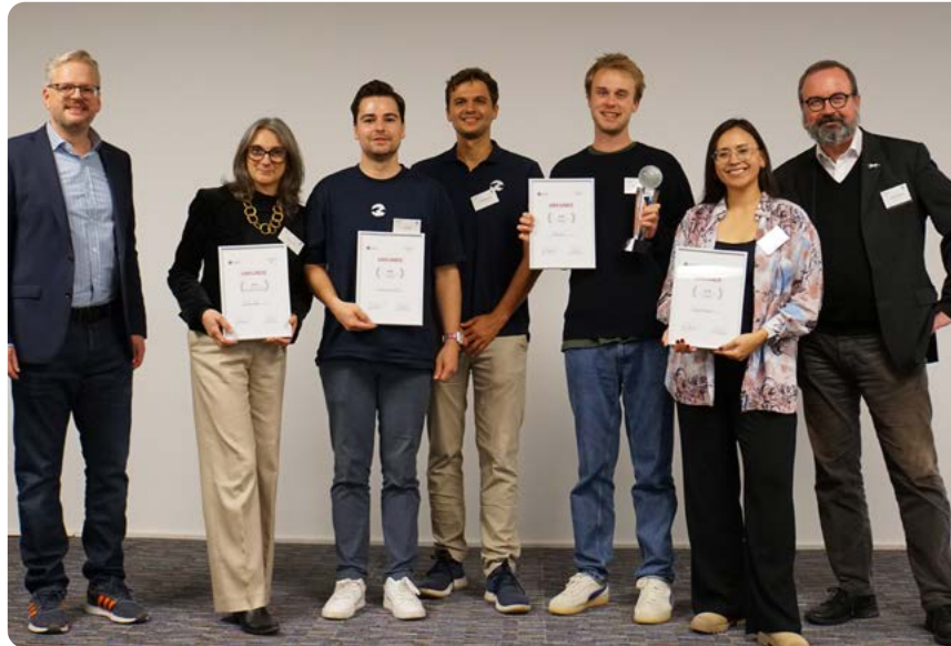
Beim Weltethos Pitch Day konnten auch 2025 ethische Start-ups wieder insgesamt 10.000 € gewinnen.