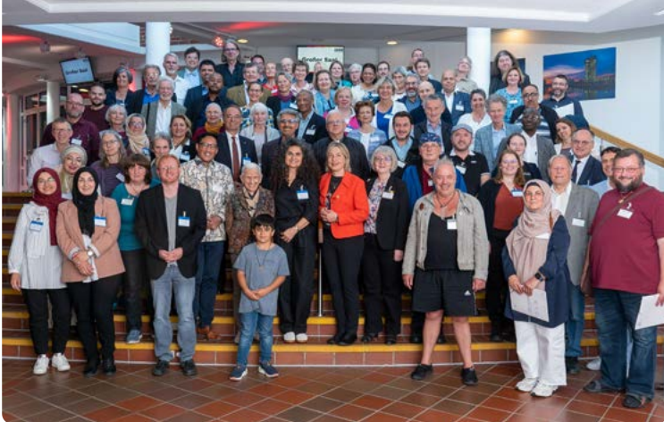
8. Bundeskongress der Räte der Religionen in Offenbach/Dietzenbach.