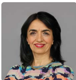
Muhterem Aras MdL Präsidentin des Landtags von Baden-Württemberg