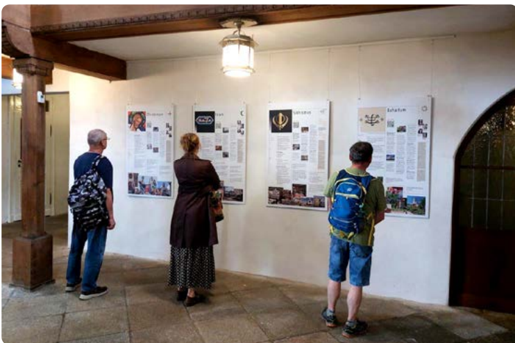
Die Weltethos-Ausstellung zu Gast im Dom St. Petri in Bautzen.

Ein besonderer Dank gilt der Margarete Müller-Bull Stiftung für ihre großzügige Unterstützung. Freuen Sie sich auf unsere Neuauflage der Ausstellung in 2026.