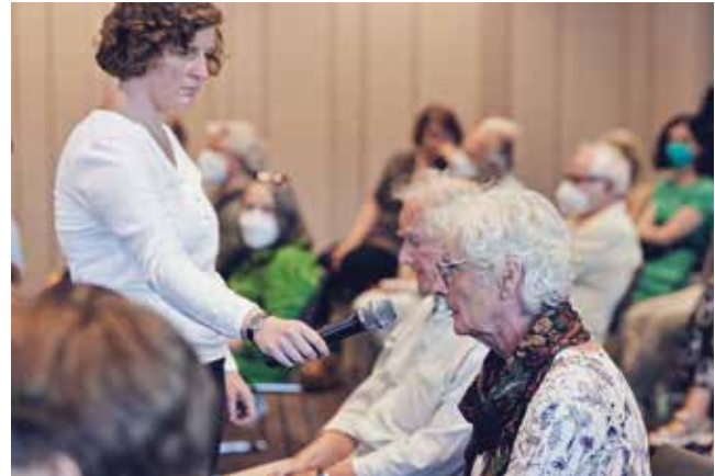
Auch das Publikum beteiligte sich rege an der Podiumsdiskussion.

Diese Veranstaltungsreihe findet für und mit Studierenden der Muslimischen Studierendengruppe, der Hochschulgruppe Gesellschaft für Dialog, des Internationalen Studentenvereins IST e. V. sowie der Ev. Studierendengemeinde und der Kath. Hochschulgemeinde statt. Das Treffen am 21. Januar stand unter der Überschrift „Berührt. Von Musik und Worten“.