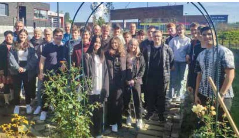
Vernetzungstreffen der Weltethos-Schulen Niederzier und Taucha, hier im Schulgarten der GSS Niederzier/Merzenich.

Unter dem Titel „Ins Wasser fällt ein Stein, oder wie junge Menschen ‚Chicago‘ heute umsetzen“ erörterte Walter Lange den Beitrag der Religionen für eine friedlichere Welt. Ganz im Sinne von Hans Küngs Credo