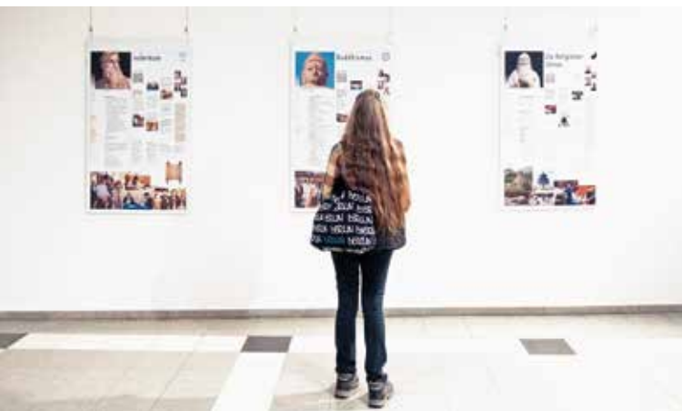
Die Ausstellung Weltreligionen – Weltfrieden – Weltethos im Amtsgericht Stuttgart.

Seit Jahren ist die Weltethos-Ausstellung ein Kernangebot der Stiftung Weltethos mit ungebrochen großer Nachfrage und anhaltend positiver Resonanz. Auch in diesem Jahr wurde sie bundesweit vielerorts gezeigt und führte ihre Besucher*innen ein in die vielfältige Welt der Religionen, deren ethische Botschaften und deren Relevanz für die heutige Zeit.