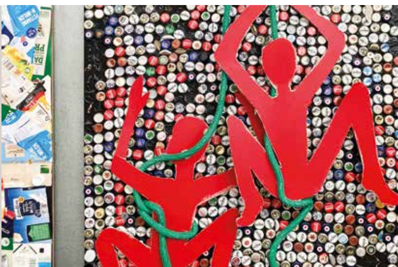
Kunst aus Müll.