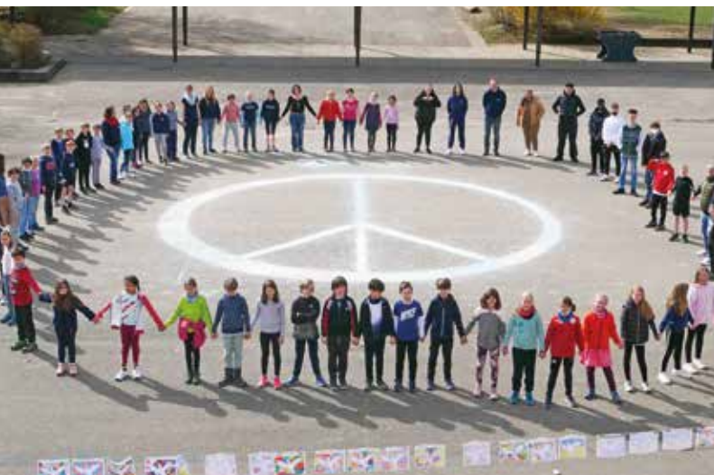
Run for Peace 2022.