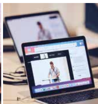
Aufzeichnung und Live-Übertragung der Veranstaltung.